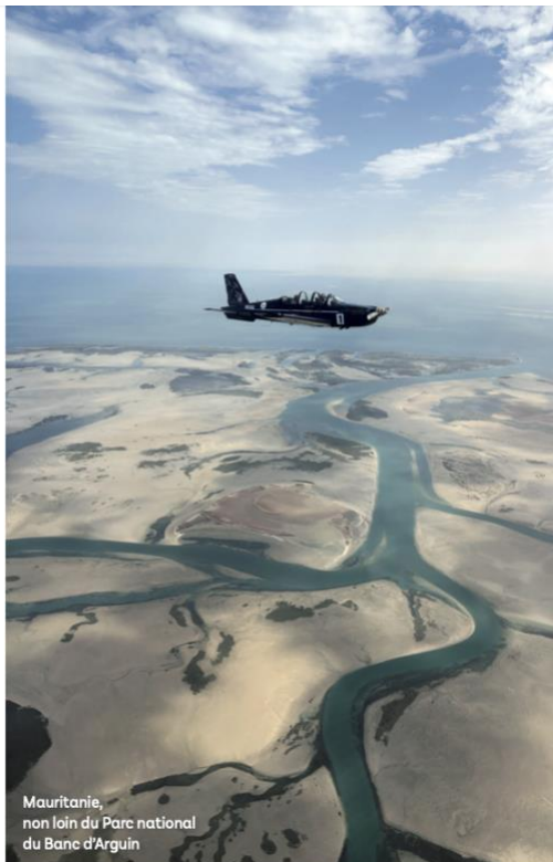
Mauritanie, non loin du Parc national du Banc d'Arguin

Evidemment, l'idée est de reprendre le trajet mythique de la Ligne... tout en composant avec les contraintes du XXI e siècle. Ainsi, le contrôle espagnol, à l'accent anglais assez particulier, apprécie moyennement les avions VFR, surtout en groupe, et a tendance à multiplier les zigzags de points de report maritimes en points d'entrée terrestres autour d'approches surpeuplées par les charters, à des altitudes que certains