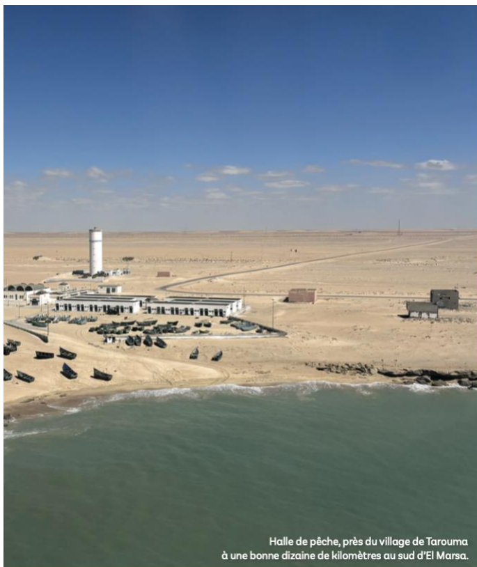
Halle de pêche, près du village de Tarouma à une bonne dizaine de kilomètres au sud d'El Marsa.