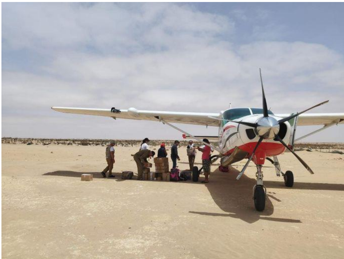
Un équipage du rallye à Tarfaya lors d'une précédente édition.

Au-delà de l'aventure sportive et mémorielle, le rallye Toulouse-Saint Louis conserve son engagement humanitaire. Depuis son lancement en 1983, les équipages acheminent en effet chaque année du matériel médical et scolaire, et des médecins et infirmiers toulousains viennent sur place former leurs confrères sénégalais via un partenariat entre l'hôpital de Saint-Louis et l'Oncopôle de Toulouse.