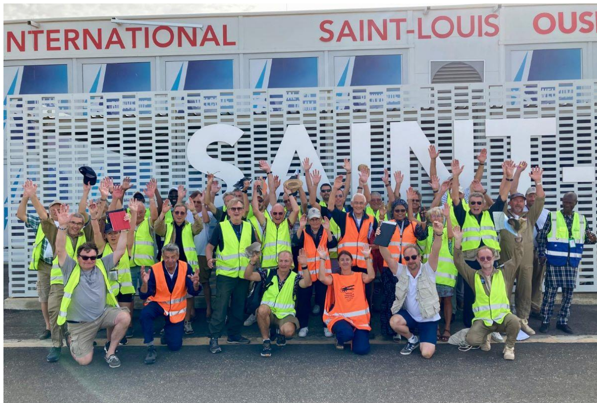
Les équipages du rallye à Saint-Louis.

Le Rallye Toulouse-Saint Louis se veut aussi un moment solidaire . Depuis les années 1980, les équipages profitent du voyage pour acheminer fournitures scolaires et médicales. Les organisateurs rappellent ainsi que depuis 2019, "ce sont plus de 40 tonnes d'équipement médical [...] qui ont été acheminées au Sénégal" .