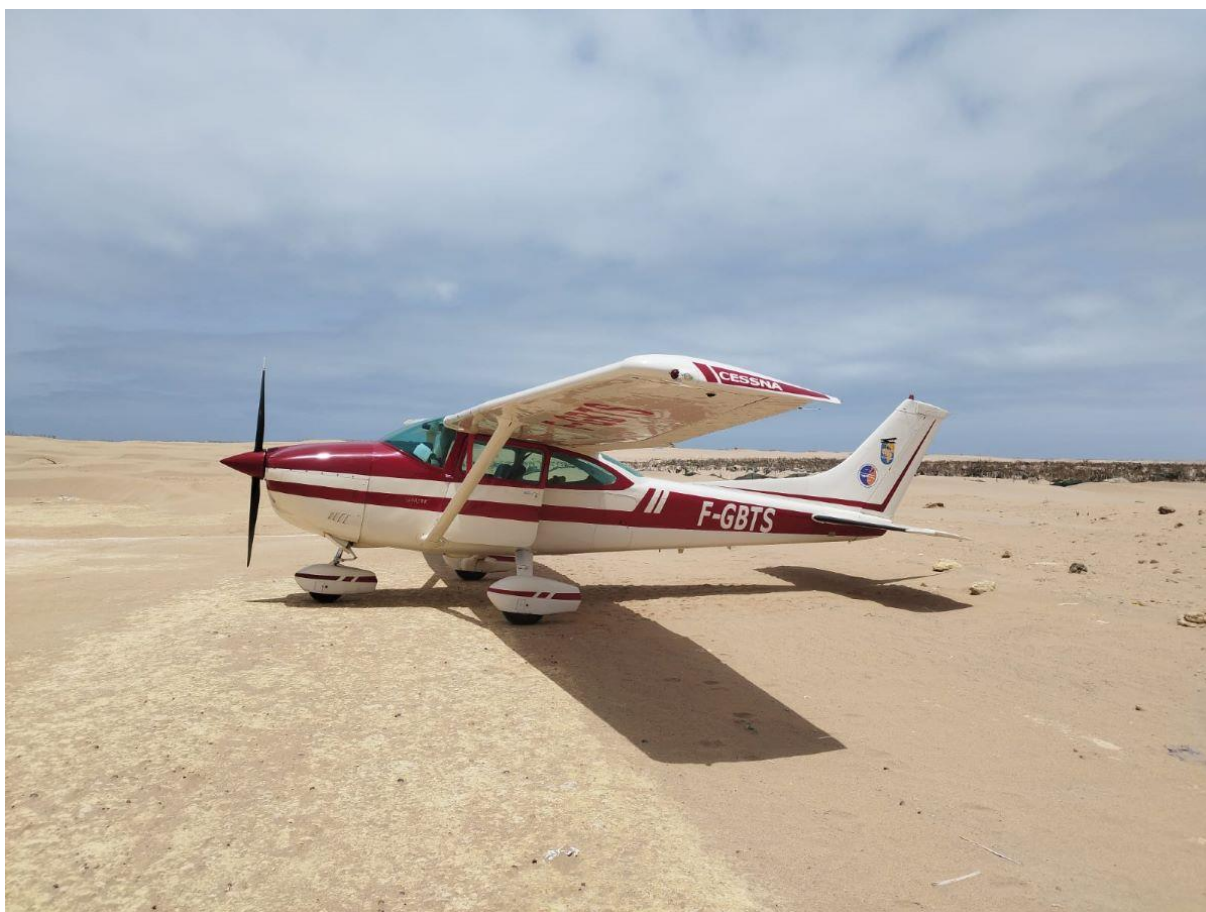
Le rallye figure parmi les plus longs et anciens rallyes aériens réguliers au monde.

E , premier avion 100 % électrique de formation et de voltige construit à Toulouse. Et pour couronner le tout, l'évènement est parrainé par Pierre-Elzéar Latécoère , arrière-petit-fils de Pierre-Georges Latécoère, le pionnier qui lança la ligne en 1918.