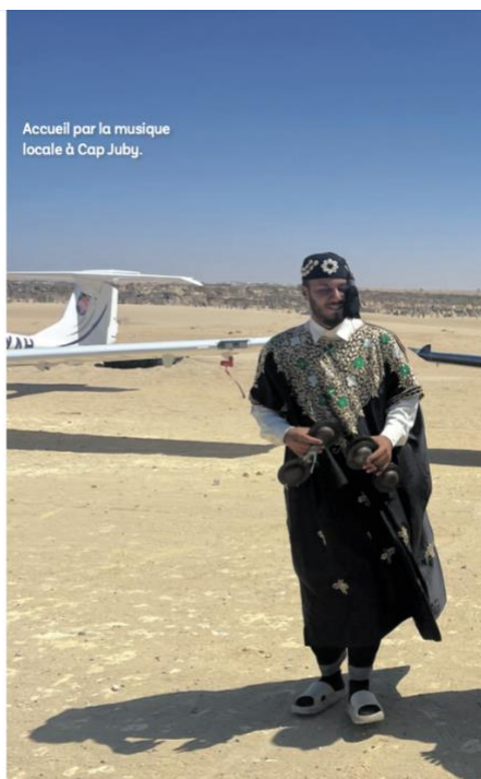
Accueil par la musique locale à Cap Juby.

Ce sont les mêmes lieux, pas les mêmes rêves. Celui qui les a mis en valeur est l'un des écrivains les plus connus au monde, ne serait-ce que pour un seul livre : Le Petit Prince . Traduit en 600 langues et dialectes, vendu à plus de 200 millions d'exemplaires, cet ouvrage rédigé sous les étoiles du Sud marocain se compare... à la Bible en termes de diffusion. Mais ce n'est pas Le Petit Prince qui justifie la quête qui anime les participants à un long pèlerinage le long des côtes méditerranéennes et atlantiques, ce sont les héros d'un autre livre du même auteur, Antoine de Saint-Exupéry : Courrier Sud .