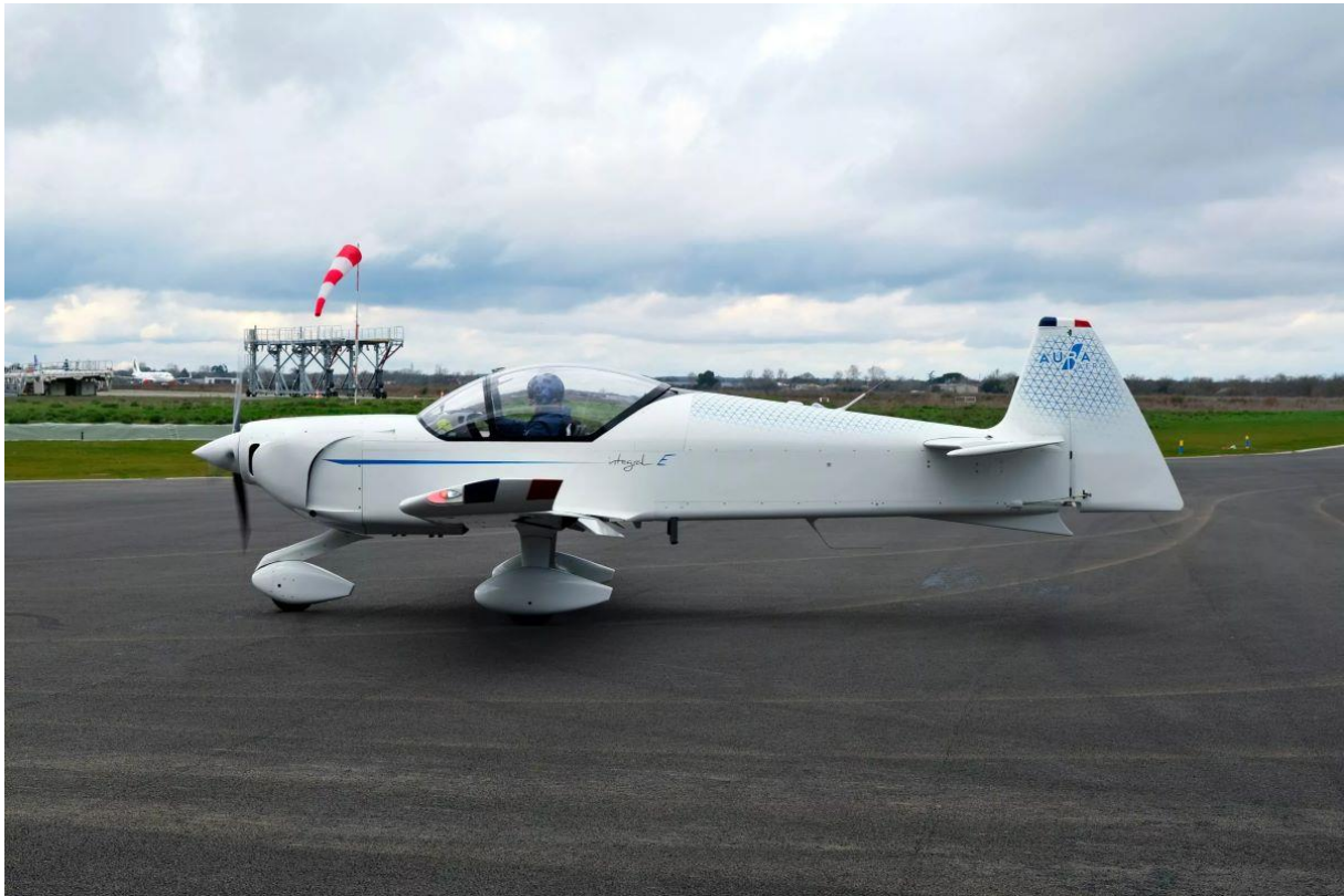
L'INTEGRAL E a réalisé son premier vol en décembre 2024, et a obtenu sa certification EASA par la suite.

Face à lui, le Bréguet XIV F-POST incarnera la mémoire. "Unique réplique volante de l'avion d'origine des lignes aériennes Latécoère et Aéropostale" , il rappelle qu'il fut le premier à transporter courrier, fret et passagers vers l'Afrique dès 1919, avant d'atteindre Saint-Louis et Dakar en 1925.