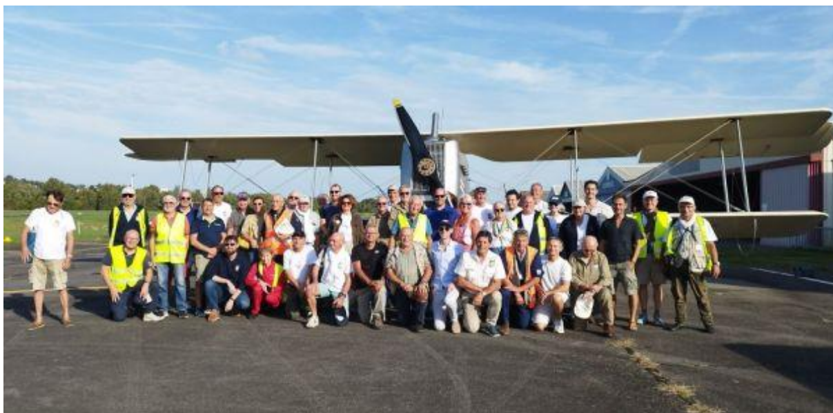
Sous les ailes de la réplique du Bréguet XIV, l'avion fondateur de la ligne, se sont réunis les 51 participants à ce 41 e rallye Toulouse – St Louis du Sénégal avant le départ pour Alicante.

d'ailleurs émis un timbre à tirage limité, commémorant l'événement, qui sera remis en récompense à l'équipage vainqueur de la compétition.