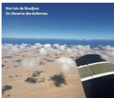
Non loin de Boudjour. On discerne des éoliennes.