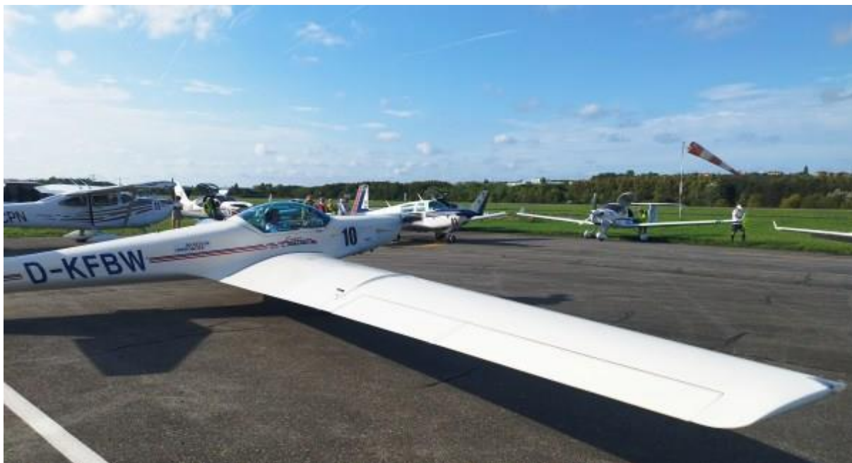
Entre l'ULM WT9 et le bimoteur P68, on retrouve pour cette édition des Cessna 172 et 182, des TB-10, 20 et 30, DR400 Mooney M20, DA40, DR250 et Fournier RF10.