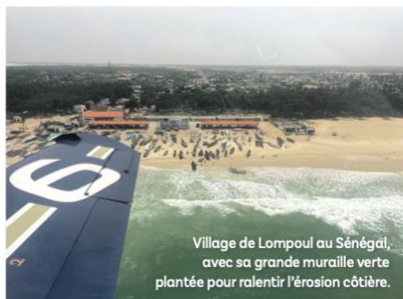
Village de Lompoul au Sénégal, avec sa grande muraille verte plantée pour ralentir l'érosion côtière.