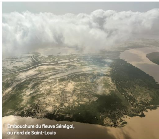
Embouchure du fleuve Sénégal, au nord de Saint-Louis