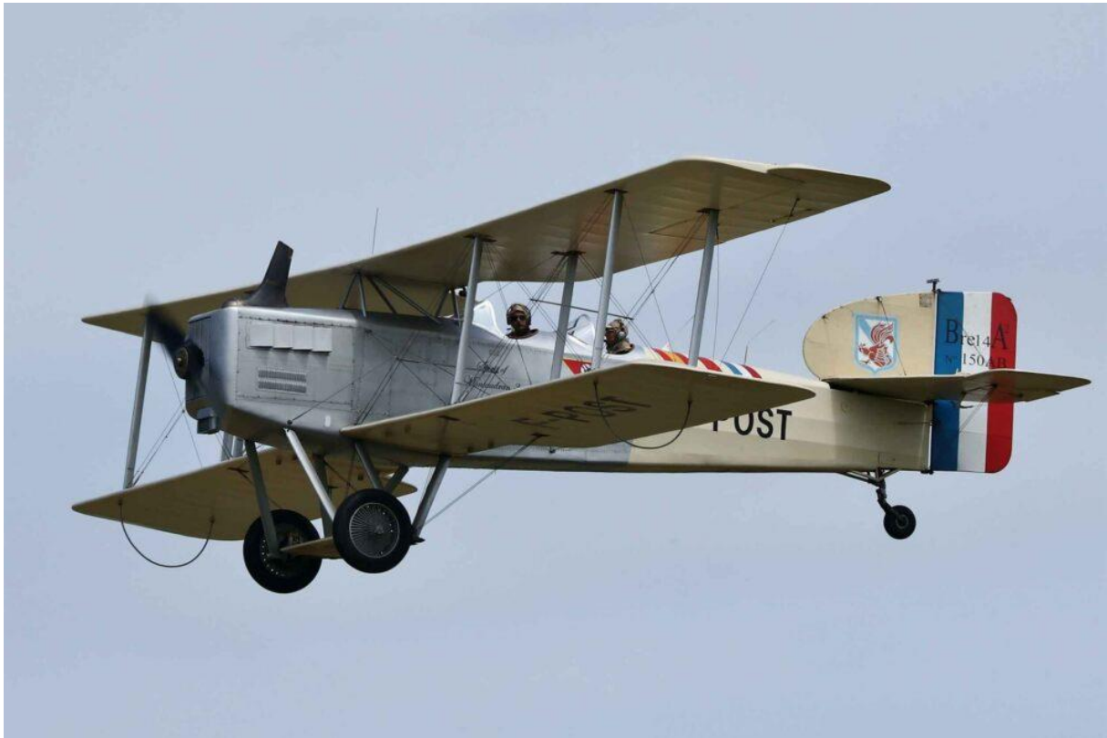
Bréguet XIV F-POST