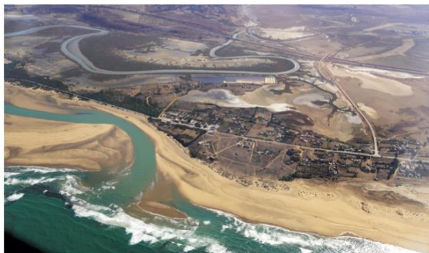
Embouchure de la rivière d'Oued Ksob, au sud d'Essaouri.

Ses 14 m 2 de surface alaire chargés à 140 kg chacun n'en font pas un voilier incomparable et la piste de Tarfaya fait 700 m de cailloux que son hélice placée basse risque de ne pas apprécier. Il fut parfait! Une visibilité exceptionnelle dans ces paysages magnifiques, la capacité de rejoindre tout appareil du rallye pour une séance photo, une fiabilité parfaite malgré des températures de fonctionnement hors-norme (essayez de faire 27 minutes d'attente par 36 °C à Nouakchott avant de décoller...), la possibilité de s'amuser entre les nuages quand la ligne droite n'est qu'une option, le confort de sièges baquets et l'ergonomie d'un monoplace militaire moderne, il n'a finalement pas consommé davantage au kilomètre parcouru que les autres concurrents (à part le motoplaneur engagé et le diesel) sur l'ensemble du rallye en tournant 80 % du temps à 60 % de la puissance à très basse altitude. 55 litres/heure pour une vitesse moyenne de l'ordre de 155/160 kt à basse altitude par temps chaud sont parfaitement honorables. Son meilleur parcours? Saint-Louis - Dakhla sur 470 NM, en 3 h 15 pour 150 litres à 144 kt, soit 46 l/h avec un vent arrière moyen de 5 à 7 kt, et plus d'une heure de réserve à l'arrivée. Seule la place pour les bagages est un handicap quand on amène un outillage assez complet et quelques pièces; il faut apprendre à faire compact et vivre sur peu de vêtements... et se remettre à la lessive.