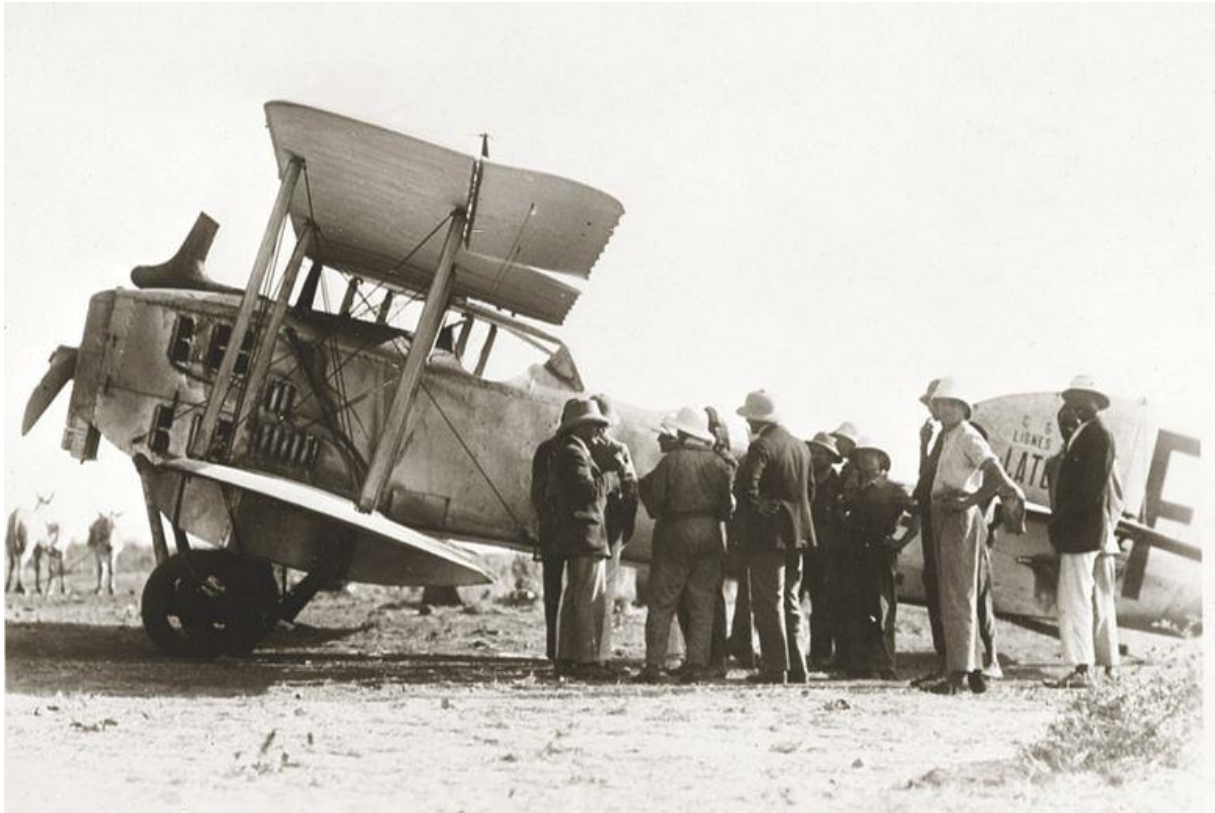
Arrivée du Bréguet XIV à Dakar après la première liaison Casablanca-Dakar en juin 1925.