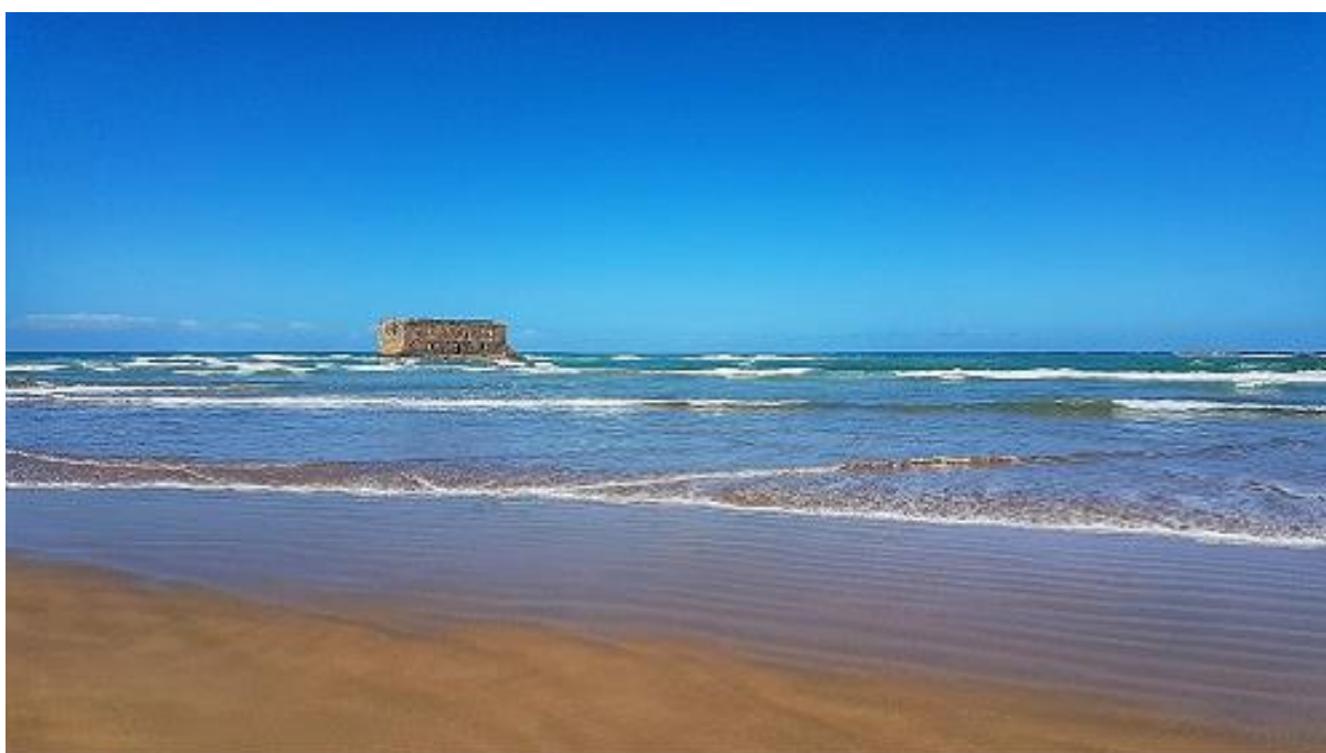
Tarfaya, l'une des étapes mythiques du Rallye