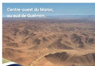
Centre-ouest du Maroc, au sud de Guelmim.