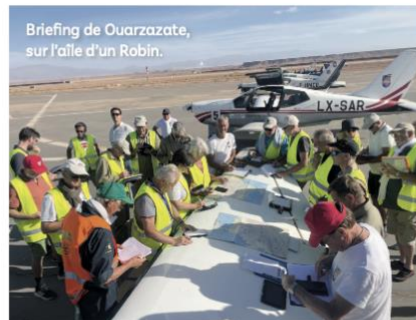
Briefing de Ouarzazate, sur l'ailé d'un Robin.

La suite ? On ne rêve que d'une chose : y retourner ! ●