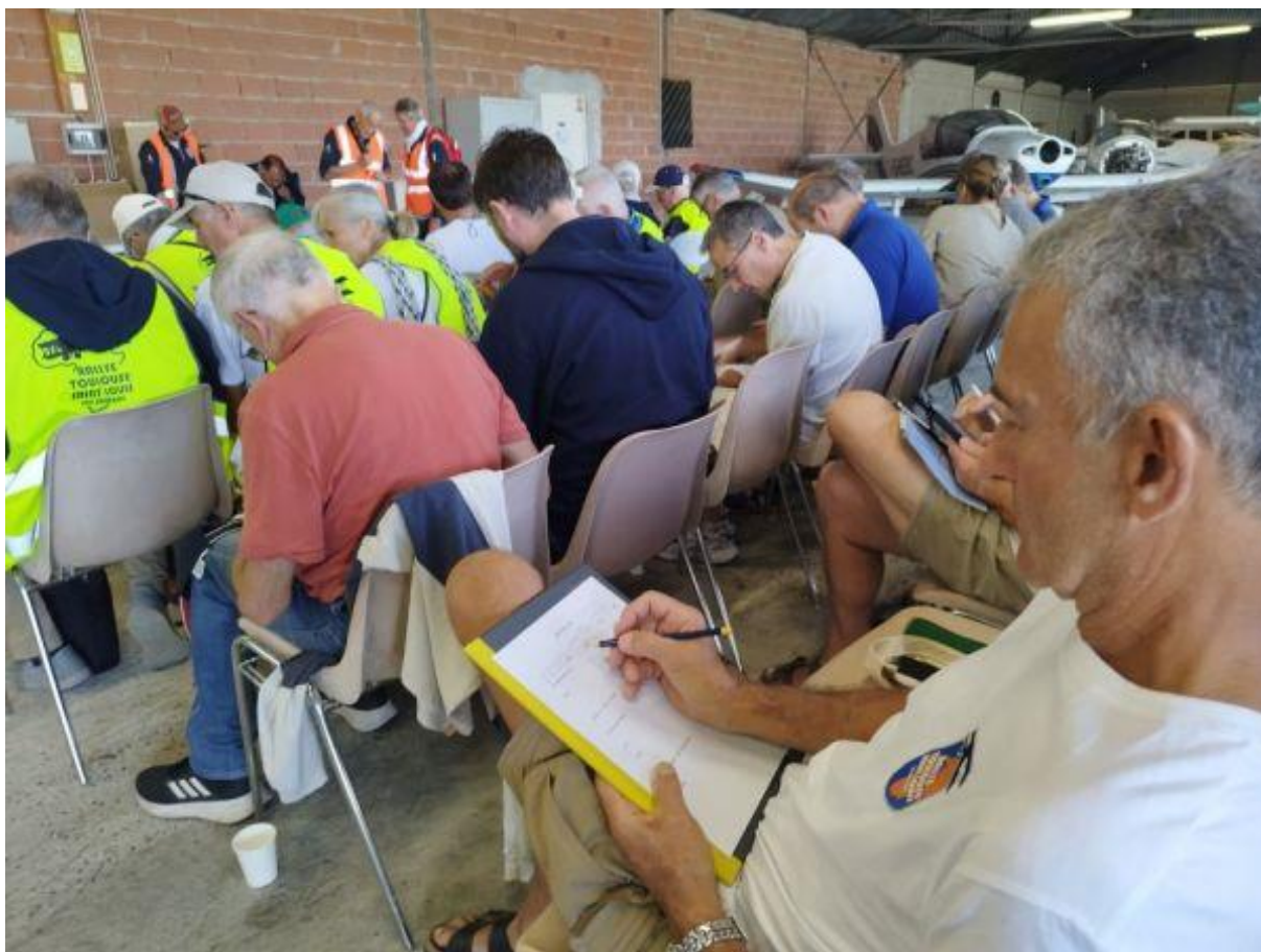
Ambiance studieuse au briefing avant départ, autour du directeur des vols.

Les 17 équipages venus de France, du Luxembourg, de Suisse, d'Allemagne et même des États-Unis mettent leurs ailes dans celle des pionniers, de Latécoère, Mermoz, Saint-Exupéry et tous ceux qui ont fait la Ligne.