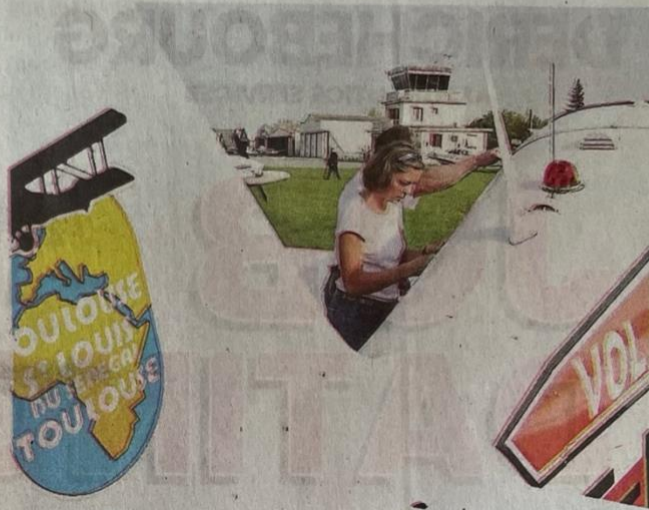
La 41 e édition partira le 20 septembre 2025 de l'aérodrome Toulouse-Lasbordes.

Durant deux semaines, soixante passionnés venus de France, du