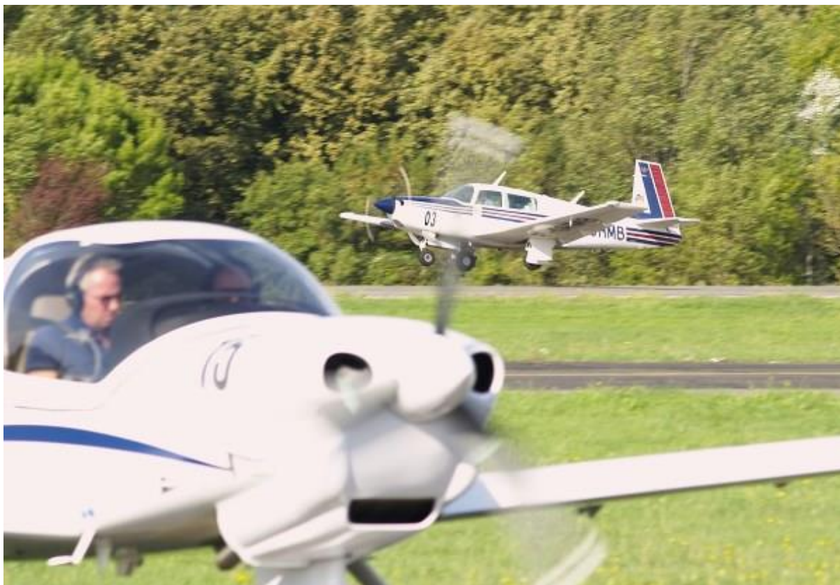
Le Mooney M20 s'élance parmi les premiers.