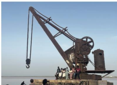
Grue à vapeur à Saint-Louis du Sénégal, sur le quai Roume, témoin du passé colonial.

est reine en termes de provenance, d'expérience, de génération et de volonté de partager. Nous ne fûmes pas déçus. Que de belles rencontres, parfois rapides autour de la bière du soir, parfois plus longues et répétées au cours de dîners ou de briefings où chacun partage ses anecdotes et expériences. De l'ancien pilote de ligne au patron de PME, du professeur à l'artisan, de l'ancien