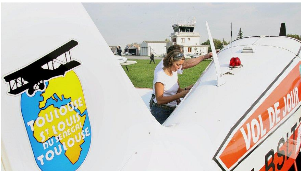
La 41e édition partira le 20 septembre 2025 de l'aérodrome Toulouse-Lasbordes.

Aéronautique , Transports , Histoire - Archéologie