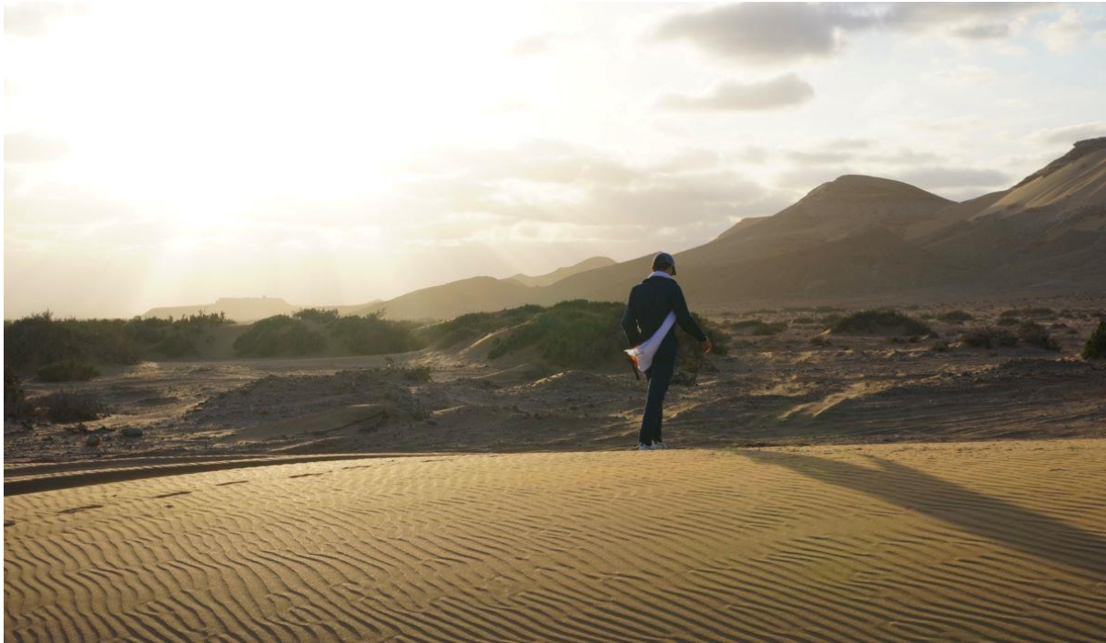
Pilote dans le désert lors d'une précédente édition du rallye.

un décor qui inspira à Antoine de Saint-Exupéry son premier roman Courrier Sud . À Dakar , les participants fêteront le centenaire de la ligne France-Afrique à l'Aéroclub Jean-Mermoz. Enfin, à Saint-Louis , les enfants de la ville accueilleront les équipages, impatients de profiter de leur baptême de l'air, " des étoiles plein les yeux ".