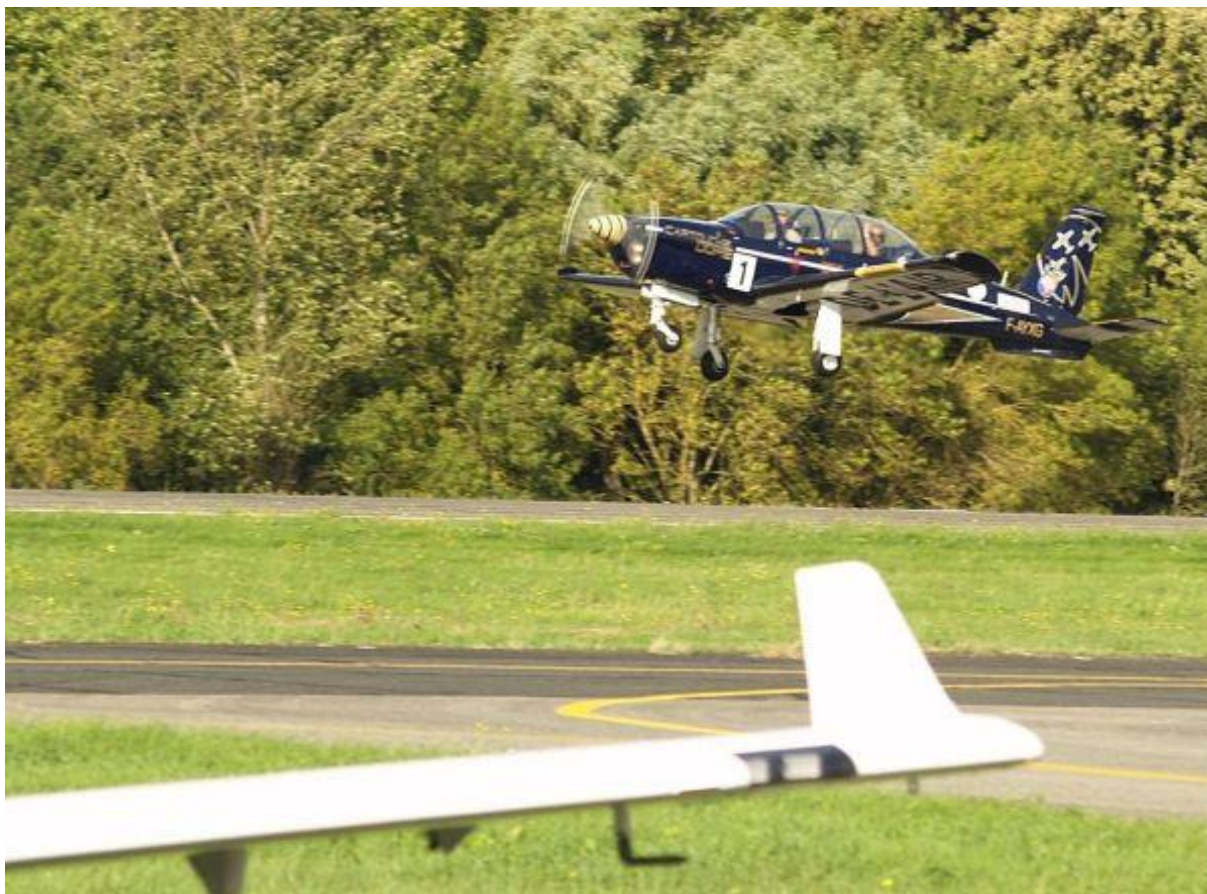
Le TB-30 devrait parcourir la première étape en 2h15.