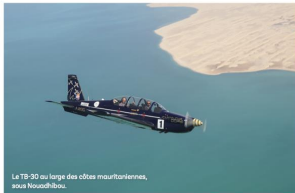
Le TB-30 au large des côtes mauritaniennes, sous Nouadhibou.

P ort-Étienne, Villa Cisneros, Cap Juby... Certains noms font rêver sans même que l'on réalise exactement ce qu'ils sont. Depuis un siècle, ces lieux sont gravés au fronton du temple de l'aventure. Aventure aéronautique en l'occurrence, alors même que ceux qui les ont fait connaître avaient seulement l'impression de faire leur travail. Nouadhibou, Dakhla, Tarfaya, vous trouverez ces noms plus facilement sur la carte de la côte de l'Afrique de l'Ouest.