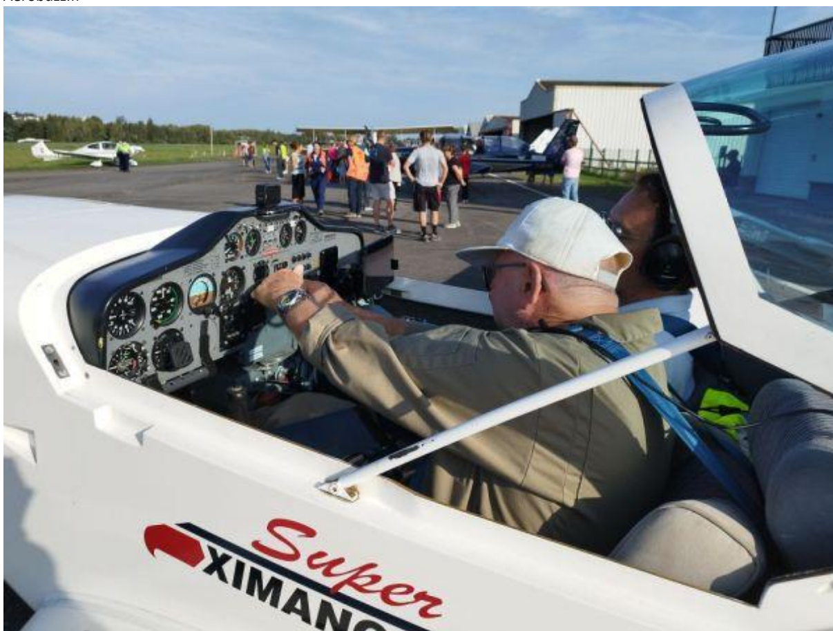
Derniers réglages à bord du Fournier RF10.